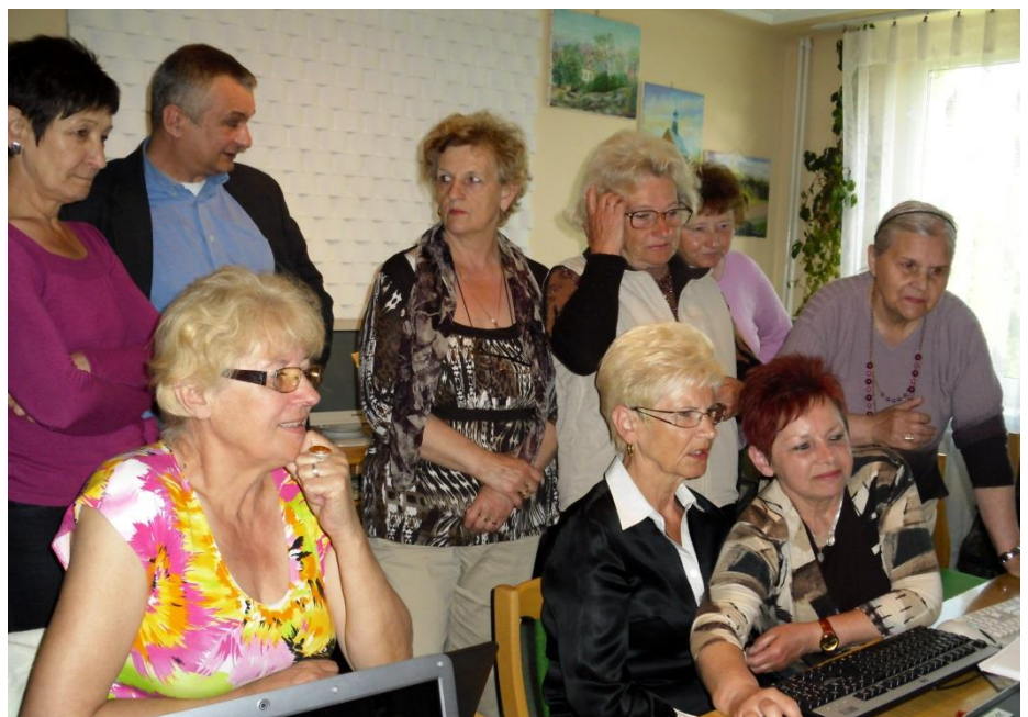
Fot. 3 Szkolenie dla seniorów w Chęcinach.

Organizowano spotkania literacko-muzyczne pt. „Wielcy Polacy”. Uczestnicy mieli okazję do tej pory zapoznać się z twórczością m.in. Juliusza Słowackiego, Fryderyka Chopina czy Wisławy Szymborskiej.