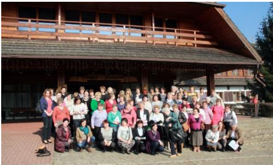
Fot. 1 Drugie Spotkanie Sieciowe w Kazimierzu Dolnym

Po powrocie i pysznym obiedzie odbyły się kolejne wspólne