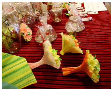
Fot. 2 Prace Stowarzyszenia Twórczych Kobiet „Talent i Pasja”

Jak sama nazwa wskazuje połączyła Nas Kobiety „pasja” do tworzenia rękodzieła, która głęboko ukryta zbudziła się podczas kursów warsztatowych organizowanych na terenie naszej gminy Bieliny.